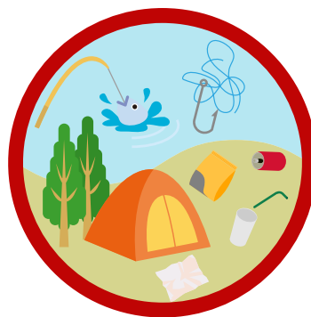
レジャーで出たごみ 釣り針のついた釣り糸 など