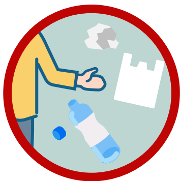
ポイ捨てされた ペットボトル