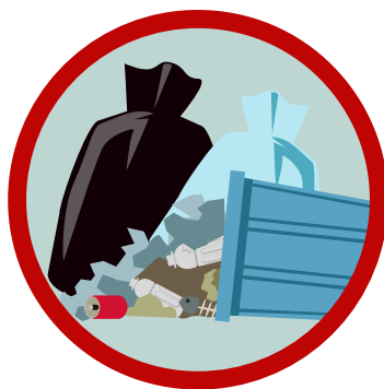
ゴミステーションから 散らばったごみ