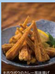
キホウボウのカレー風味揚げ