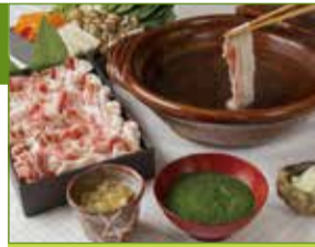
料理旅館 松屋旅館