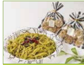
ハーブ アンド カフェレストラン 祐