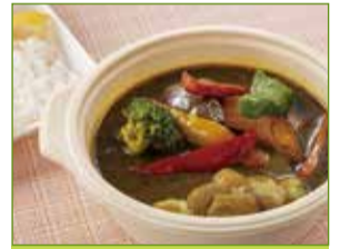
カーササローネ伊太利亜