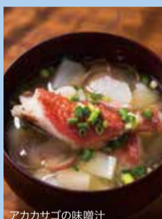
アカカサゴの味噌汁