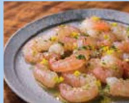
タカエビのカルパッチョ